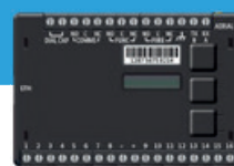
UC240 Doppia comunicazione IP e 4G/2G